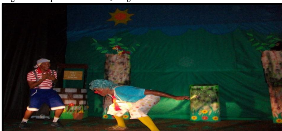
Figura 5 - Espetáculo O Nariz Mágico

O espetáculo infantil “O nariz mágico” tornou-se o carro-chefe da Companhia e tinha a missão de despertar nas crianças o gosto pela arte da cena, ou seja, tornando espetacularizável a verdade cênica. Nesses propósitos, espetacularizar significa “fazer disso o objeto de uma ostentação e de uma observação; não, se este objeto deve ser também espetacular, deve causar espanto e fascinar um observador” (PAVIS, 2011, p. 142), sendo, pois destinado às crianças.