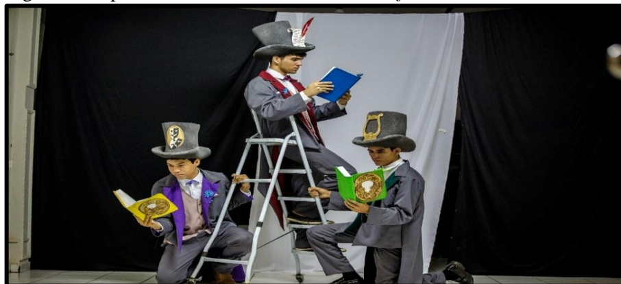
Figura 6 - Espetáculo Letras Em Cena: Uma Performance Poética

uma performance poética”, que apresenta um figurino impecável, seguido de um trabalho corporal e vocal dos atores, o que demonstra compromisso também no fazer teatral, conforme observado na imagem seguinte.