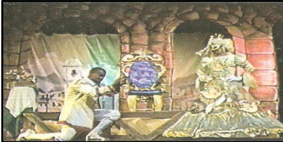
Figura 3 - Espetáculo Chico Rei