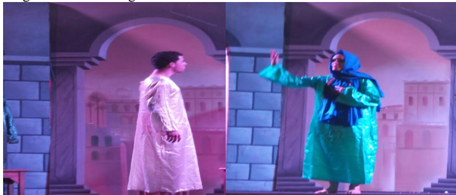
Figura 2 -Auto Religioso São Sebastião

Diante disso, é preciso valorizar as intervenções no campo da teatralidade, independentemente da instituição religiosa que organiza e propõe ao público o acesso às manifestações teatrais. De tal modo, outra vertente demonstrativa da cena teatral no município também está ligada à Igreja Católica, que é a encenação do Auto de Sebastião , padroeiro da cidade, que costuma acontecer no mês de janeiro, período das festividades religiosas em homenagem ao santo padroeiro. A montagem em pauta pode ser observada na imagem seguinte.