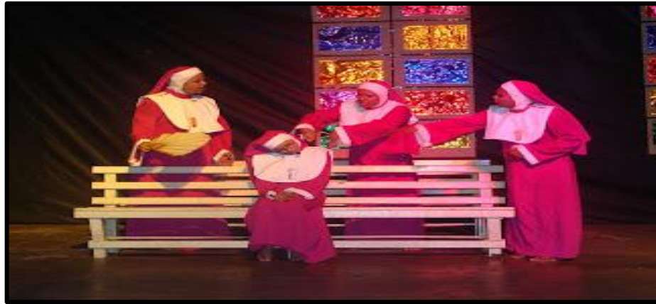
Figura 4 - Espetáculo Um Velório No Convento

Há, nesse sentido, uma crítica aos gestores culturais ligados aos órgãos públicos, pois, muitas vezes, privilegiam determinados grupos porque estes comungam de seus propósitos políticos. Nesse sentido, a arte não pode se aliar a nenhum grupo com ideologias de massificação, até porque representa uma forma de problematizar e denunciar as mazelas sociais vividas pela população.