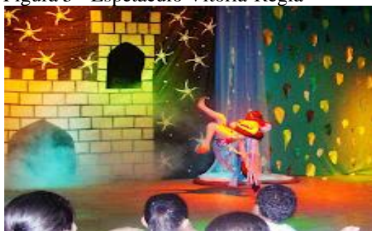
Figura 5 - Espetáculo Vitória-Régia