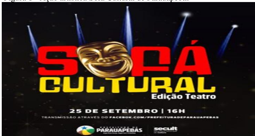
Figura 8 - Ação artística Sofá Cultural de Parauapebas