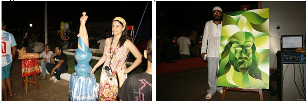
Figura 2 - Movimento eternista em Parauapebas

As cenas artísticas de Parauapebas estavam aos poucos sendo construídas e imbuídas desse propósito do Movimento Eternista, que tinha como marca a pintura sempre em formato de espiral, indicando algo interminável, infinito e que também marcou a cena cultural no município. O grupo não se constituía da formação de uma companhia teatral, mas de um coletivo em que agregava vários artistas como atores, artistas plásticos, artesãos, músicos, chargistas, cineastas, jornalistas e poetas que tinham a finalidade de apresentar o contexto amplo das manifestações artístico-culturais desenvolvidas na cidade.