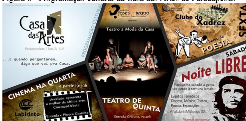
Figura 6 - Programação cultural da Casa das Artes de Parauapebas

Apesar de não haver, à época, políticas culturais que fortalecessem o fazer cultural dos artistas dos mais variados ramos, a Casa das Artes teve uma temporada curta, mas significativa para a construção da cena militante no município, em que foi criado o grupo Fases, responsável por experimentar técnicas e jogos teatrais na construção das personagens, sendo que cada linguagem artística tinha um dia específico de realização no trabalho de formação de plateia, conforme a seguinte visualidade apresentada.