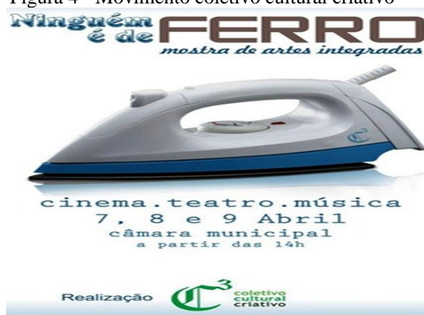
Figura 4 - Movimento coletivo cultural criativo

E como uma proposta de vanguarda, surgiu o Coletivo Cultural Criativo na realização das intervenções culturais na ampliação dos agentes promotores de cultura, na formação de plateia às manifestações artísticas e no trabalho da cena, que planejou e realizou uma mostra unindo teatro, música e cinema da movimentação da cena artística no município.