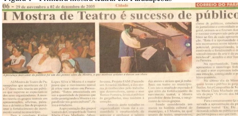
Figura 1 - Primeira mostra teatral em Parauapebas

Nessa concepção, ao vislumbrar o panorama artístico e performático do fazer artístico da caracterização da cena do teatro na cidade, isso possibilita-nos enxergar como o movimento cultural vem se organizando, sobretudo com a realização no ano de 2005 da primeira Mostra de Teatro de Parauapebas, evento que marcou a existência do teatro na cidade de fato, sendo veiculada em alguns jornais impressos da cidade à época, simbolizando um marco histórico na construção da cena teatral no sudeste paraense, conforme recorte da visualidade artística documentada em um dos jornais do município.