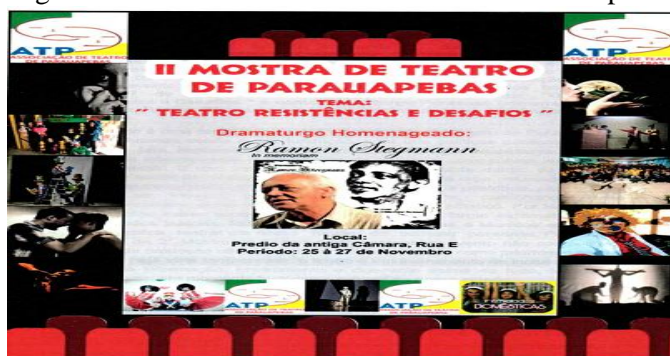
Figura 7 - Folder da II Mostra de Teatro de Parauapebas

Nesse sentido, os espaços inusitados têm sido o lugar de realização das montagens cênicas no município que passou a ganhar um pouco de notoriedade com a construção do Centro Cultural de Parauapebas, em que a relevância da mostra se mostrou pelo ineditismo das produções e da apresentação do primeiro grupo de formas animadas, com a apresentação do teatro de bonecos da companhia Outro Mundo, existente na cidade de Parauapebas, em que os atores-manipuladores realizaram um notável trabalho de vida manipulável dos bonecos e, sem sombras de dúvidas, apesar de uma tímida participação de público, a cena teatral parauapebense ressurgiu de maneira insistente, resistente, militante e como acontecimento, conforme a identidade do folder que demarcou a existência relevante das montagens cênicas.